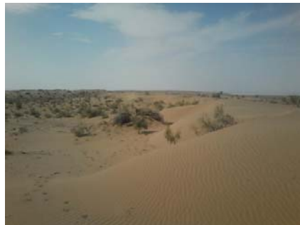
ب. تپه‌های طولی در ریگ چاه جام

شکل ۲. نمونه‌ای از عوارض موجود در ژئومورفوسایت‌های مورد مطالعه