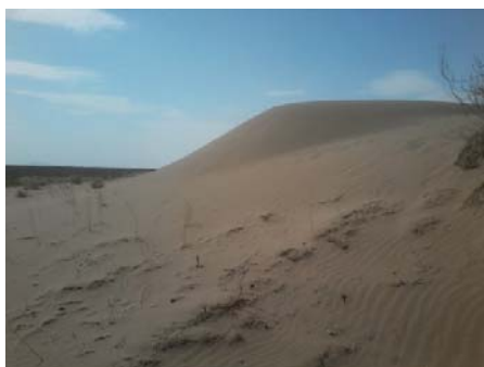
ب. تپه ماسه‌ای در کویر رضا آباد

چشم‌اندازهای ژئومورفولوژیکی مناطق کویری و بیابانی شهرستان شاهرود برای شناسایی و بهره‌گیری با رویکرد گردشگری پایدار، نیازمند معرفی و شناسایی خصوصیات ژئومورفولوژیک آنهاست. این ژئومورفوسایت‌ها که از نظر موقعیت جغرافیایی در مناطق خشک تشکیل شده‌اند، به دلیل تنوع مورفولوژیک، دارای شرایط متنوعی در چگونگی شکل‌گیری عوارض هستند. این ژئومورفوسایت‌ها که در پژوهش پیش رو با استفاده از مشاهدات میدانی و مطالعات کتابخانه‌ای مورد ارزیابی قرار گرفته‌اند، شامل ریگ نجارآباد، کویر طرود، ریگ چاه‌جام، دق بیارجمند، ارگ خارتوران، دق اسماعیل مهلو و کویر رضا آباد می‌باشد. در شکل ۲ نمونه‌ای از ژئومورفوسایت‌ها نشان داده شده است.