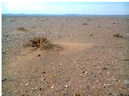
ت. پیکان ماسه‌ای در ریگ نجارآباد