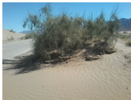
الف. نیکا در ریگ چاه جام