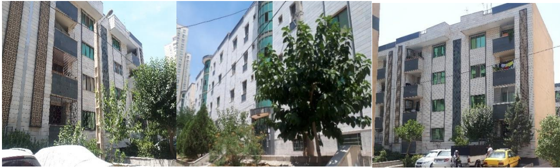
تصویر شماره ۴- عکس هایی از نمایی شهرک مسکونی ساحلی