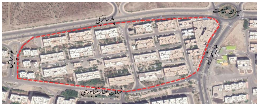
تصویر شماره ۵- عکس هوایی شهرک مسکونی امید دژبان

شهرک امید دژبان یکی از شهرک هایی است که حدود ۱۲ سال پیش در قسمت شمالی بزرگراه همت در منطقه ۲۲ ساخته شده است. شهرک امید دژبان یکی از شهرک های معروف و با قدمت در این منطقه است که توسط تعاونی مسکن ارگان ارتش ساخته شده است. در این شهرک، حدود ۸۵۰ واحد مسکونی وجود دارد که این واحد ها، بین ۲۸ بلوک ۴ طبقه تقسیم شده اند، بدین صورت که در هر کدام از بلوک ها، ۳۶ واحد مسکونی وجود دارد.