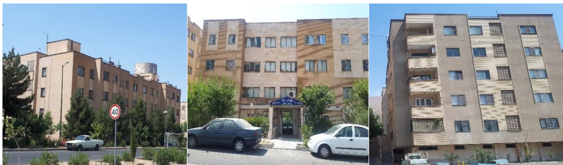
تصویر شماره ۶- عکس هایی از نمایی شهرک مسکونی امید دژبان

تمام واحد های این ساختمان ها دارای پارکینگ و انباری می باشد. در برخی از بلوک ها نیز، آسانسور تعبیه شده است. شهرک امید دژبان، دارای دو تپ سازه است. برخی از بلوک ها از اسکلت بتنی و برخی از بلوک ها از اسکلت فلزی تشکیل شده است. نمای برخی از ساختمان ها را سنگ و آجر و نمای برخی دیگر را سیمان تشکیل داده است.