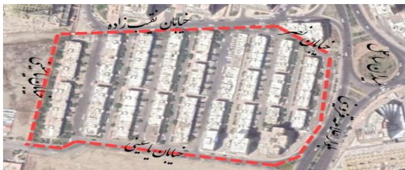
تصویر شماره ۳- عکس هوایی شهرک مسکونی ساحلی

شهرک ساحل یکی از قدیمی ترین شهرک های منطقه ۲۲ می باشد که دارای قدمتی ۱۵ ساله می باشد. این شهرک که در ضلع شمالی دریاچه چیتگر واقع شده قدیمی تر از دریاچه می باشد. این شهرک توسط تعاونی مسکن فرهنگیان اجرا و ساخته شده است.