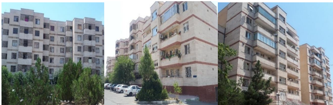
تصویر شماره ۲- عکس هایی از نمایی شهرک مسکونی شهید باقری (منبع: نگارندگان)

آن منفی و متعلق به پارکینگ، ۱ طبقه متعلق به لابی به همراه لابی من ۲۴ ساعته و ۱۲ طبقه مثبت می باشد. از نکاتی که درباره این برجها باید دانست، سازنده آن است که شرکت ظفر کار که از تعاونی های سپاه محسوب می شود می باشد. همانطور که گفته شد، این برجها دارای ۱۲ طبقه مثبت هستند ولی بسته به نوع مترائز، تعداد واحدها در طبقات متفاوت می باشد؛ بدین صورت که در طبقات ۱ الی ۸، در هر طبقه ۶ واحد و در طبقات ۹ الی ۱۳، در هر طبقه ۴ واحد وجود دارد. مترائز واحدها در این برجها از ۹۶ متر الی ۱۳۷ متر می باشد و به صورت ۲ خواب و ۳ خواب، طراحی شده اند.