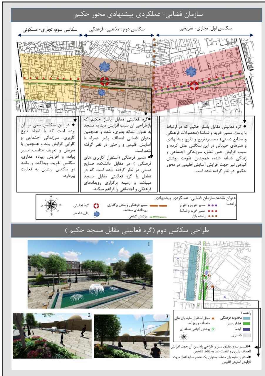
نقشه ۳- سازمان عملکردی-فضایی پیشنهادی محور حکیم