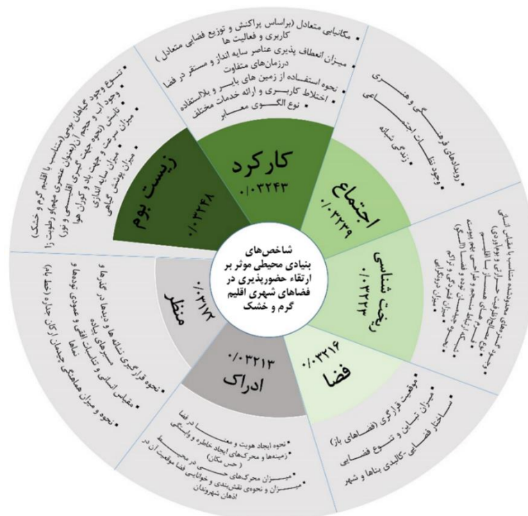
شکل ۱- مدل مفهومی شاخص‌های محیطی مؤثر بر ارتقاء حضور پذیری فضاهای شهری مناطق اقلیم گرم و خشک

قرار دارند. در نهایت، مدل شاخص‌های بنیادی محیطی مؤثر بر ارتقاء حضور پذیری در فضاهای شهری اقلیم گرم و خشک با ۳۱ شاخص و ۷ بعد موضوعی، در شکل ۱ نشان داده است. در این شکل دسته‌ها یا ابعاد به ترتیب امتیاز آن‌ها نشان داده شده و در هر بعد، شاخص‌ها به ترتیب اهمیت و اثرگذاری هر یک از آن‌ها بر ارتقاء حضور پذیری فضاهای شهری مناطق اقلیم گرم و خشک بیان شده است.