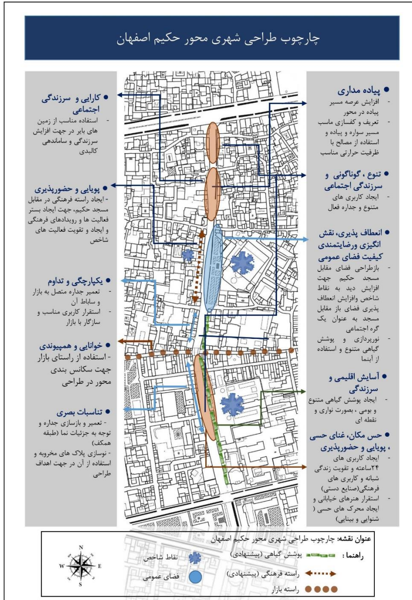
نقشه ۲- چارچوب طراحی شهری محور خیابان حکیم