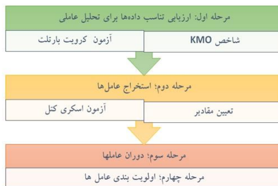
شکل ۱- مراحل انجام تحلیل عاملی

که در آن: W بیانگر ضرایب نمره عوامل و P معرف تعداد متغیرهاست. مبانی ریاضی تحلیل عاملی، برحسب مقدار و نوع واریانس هر متغیر X_i که توسط عامل‌های موجود در مدل توجیه می‌شود، متفاوت است (اصفهانی، ۱۳۹۶).