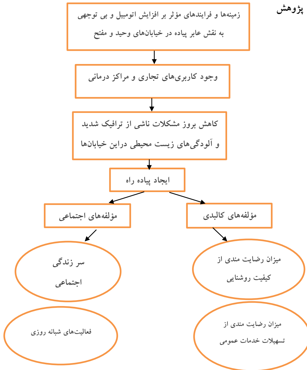
شکل ۱- مدل مفهومی تحقیق